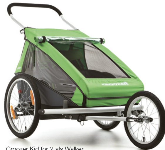
Croozer Kid for 2 als Walker

Du wählst einen Croozer und bekommst die Ausrüstung für drei Transport-Möglichkeiten: Fahrradanhänger, Buggy und den geländegängigen Walker. Alles, was du brauchst, ist in jedem Komplettpaket enthalten. Einfacher geht es nicht. Und praktischer auch nicht.