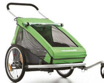
Croozer Kid for 2 als Anhänger