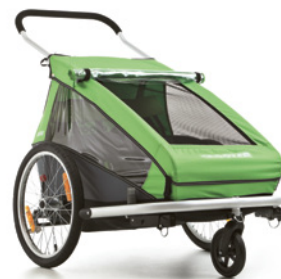
Croozer Kid for 2 als Buggy