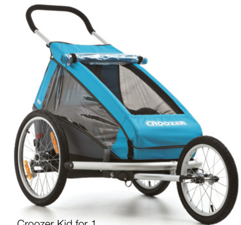
Croozer Kid for 1